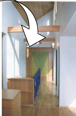
建具は全て天井高さ (H=2400) OPENにするとワンルームの空間をつくり出す