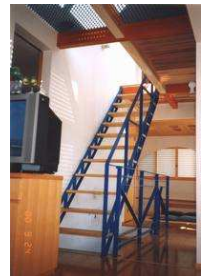
広い空間を感じさせる玄関ホール 鉄骨階段はアクセントカラーのブルー