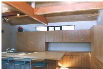
使う人に合わせた家具収納