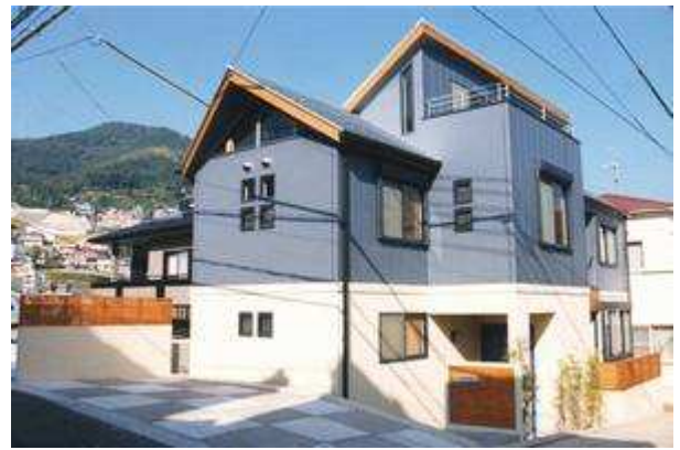
土地の形状や状況・住む人の生活スタイルに合わせ 採光・通風を十分考えた設計

敷地面積：110㎡ (33.16坪) 1階床面積：52㎡ (15.67坪) 2階床面積：55㎡ (16.58坪) 延床面積：107㎡ (32.26坪)