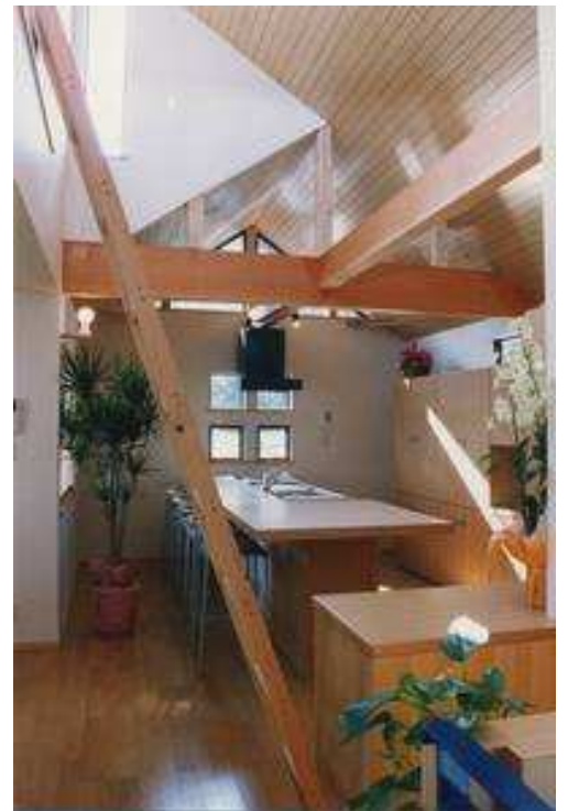
居間・食堂・台所は、 通風と採光を確保しやすい2階に配置