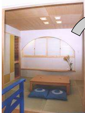
リビング奥のモダンな和室